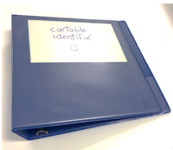
1 cartable 1 po