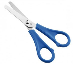
Ciseaux à bouts ronds et lames en métal