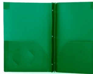
1 duo-tang en plastique avec attaches et pochettes