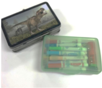
1 coffre à crayons qui peut contenir tous les crayons

TOUT LE MATÉRIEL DOIT ÊTRE BIEN IDENTIFIÉ.