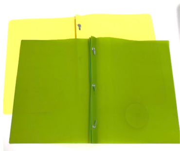
2 duo-tang sans pochette